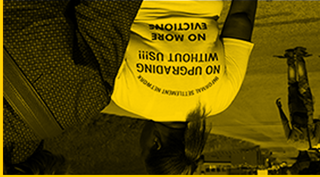
No Upgrading without us © Dagmar Hoetzel