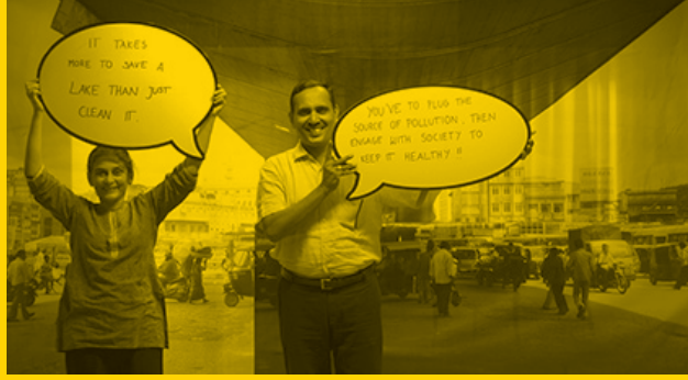
Participants in the NextBangalore Space